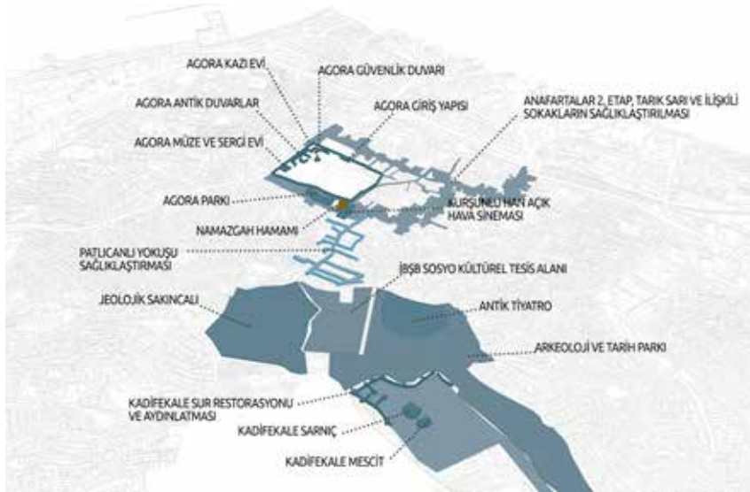
Şekil 2. İzmir Tarih Projesi kapsamında Namazgâh Hamamı ve çevresindeki alt projeler.

İzmir Tarih Projesi ile tüm bu çalışmaların bütüncül olarak çizilmiş bir vizyon içerisinde bölge halkının, sivil toplum örgütlerinin, diğer yerel idarelerin, özel sektörün makro ve mikro kararlar düzeyinde katılımıyla bölgenin yeni dinamikleri de göz önüne alınarak devam ettirilmesi ve geliştirilmesi hedeflenmiştir. Smyrna Antik Kenti'nde yer alan Agora, Antik Tiyatro, Kadifekale, Altınpark, Cicipark arkeolojik odaklarının birbirleriyle ve kent yaşantısıyla entegrasyonunun sağlanması, bu mekânlara erişimin sağlıklı bir şekilde yapılabilmesi ve bu alanları bağlayan arterlerin