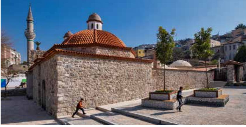
Şekil 3a. Namazgâh Hamamı kuzeybatı görünüşü.

iki kısmında, kuzeyden güneye doğru, soyunmalık, ılıklık, sıcaklık ve ikişer halvet bulunmaktadır (Şekil 3a, 3b). Halvetlerin arkasında bir su deposu ve su deposunun altında küllhan ile ateşlik bölümleri yer almaktadır. Yapının beden duvarları, kesme taş, moloz taş ve tuğla malzeme ile yığma sistemde inşa edilmiştir. Yapının üst örtüsü kubbe ve tonozlardan oluşmaktadır. Hamamın giriş cephesi olan kuzey cephesi Symrna Agorası'nı karşılamaktadır. Münir Aktepe, Namazgâh Hamamı'nın doğusunda bulunan Kurşunlu Cami yanında Kurşunlu Medrese bulunduğundan ve bu medresenin güneyinde, yakın geçmişte açık hava sineması olarak kullanılan alanda, Kurşunlu Han'ın yer aldığından bahsetmiştir. 14 Şakir Çakmak da bu tespiti destekleyecek biçimde Namazgâh Hamamı, Namazgâh (Kurşunlu) Cami ve Medresesi'nin birlikte bir külliye oluşturduğunu ifade etmiştir. 15