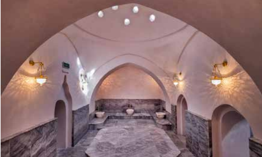
Şekil 3b. Namazgâh Hamamı sıcaklık mekânı.

iki kısmında, kuzeyden güneye doğru, soyunmalık, ılıklık, sıcaklık ve ikişer halvet bulunmaktadır (Şekil 3a, 3b). Halvetlerin arkasında bir su deposu ve su deposunun altında küllhan ile ateşlik bölümleri yer almaktadır. Yapının beden duvarları, kesme taş, moloz taş ve tuğla malzeme ile yığma sistemde inşa edilmiştir. Yapının üst örtüsü kubbe ve tonozlardan oluşmaktadır. Hamamın giriş cephesi olan kuzey cephesi Symrna Agorası'nı karşılamaktadır. Münir Aktepe, Namazgâh Hamamı'nın doğusunda bulunan Kurşunlu Cami yanında Kurşunlu Medrese bulunduğundan ve bu medresenin güneyinde, yakın geçmişte açık hava sineması olarak kullanılan alanda, Kurşunlu Han'ın yer aldığından bahsetmiştir. 14 Şakir Çakmak da bu tespiti destekleyecek biçimde Namazgâh Hamamı, Namazgâh (Kurşunlu) Cami ve Medresesi'nin birlikte bir külliye oluşturduğunu ifade etmiştir. 15